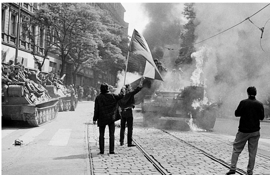
Obr. 16 – Jan Palach